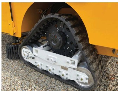
Unidad de oruga COE TRAX

El COE L2 está disponible en configuraciones de elevador de 90 o 45 grados y se combina con el lado COE C7 SHAKER para formar un conjunto de marco de captura. Hay disponible una variedad de opciones para el manejo de contenedores o a granel para adaptarse a cualquier cultivo