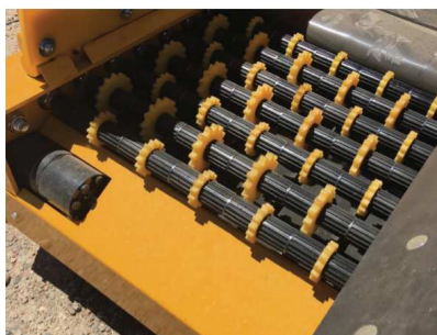
Sistema de limpieza de basura De-Stiker